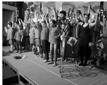
Eröffnung des Grünauer Kultursommers am 10. Juni mit dem Mehrgenerationenmusik- theaterprojekt „Brundibár“